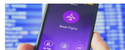
PROCÉDURE DE CANDIDATURE