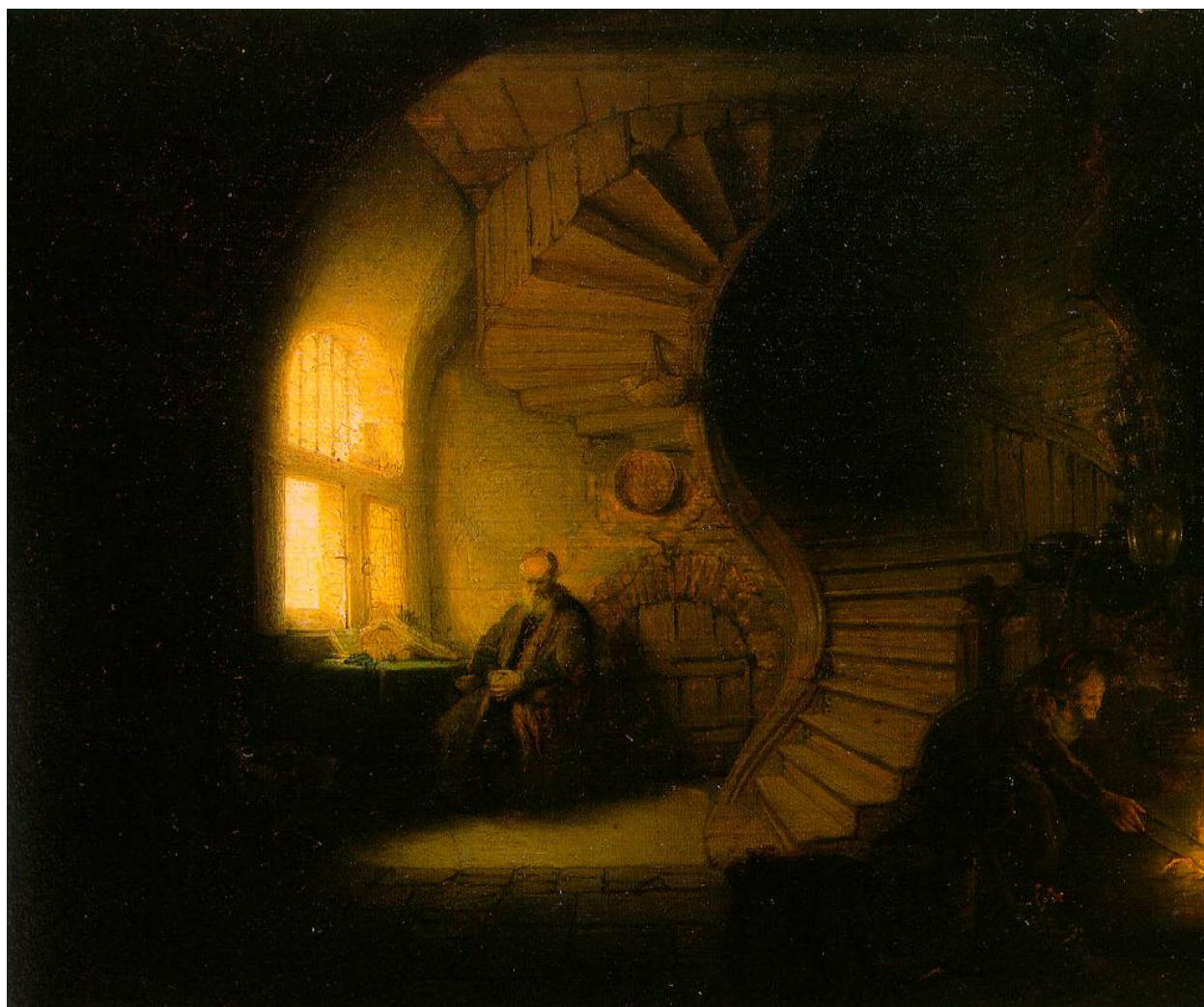
REMBRANDT, Philosophe en méditation (1632)