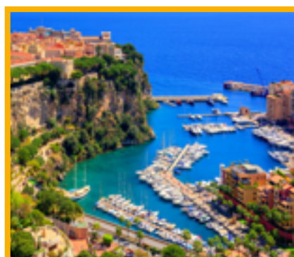
Journée à Monaco