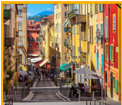
Visite du vieux Nice