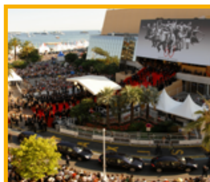
Journée à Cannes