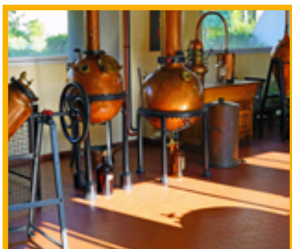
Visite de l'usine Galimard & atelier de parfum