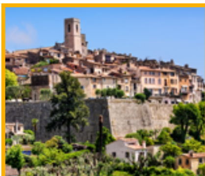
Journée à Saint Paul de Vence