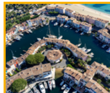
Journée à Saint Tropez