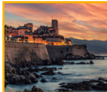
Journée à Antibes