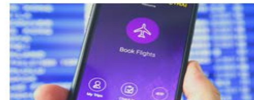
PROCÉDURE DE CANDIDATURE